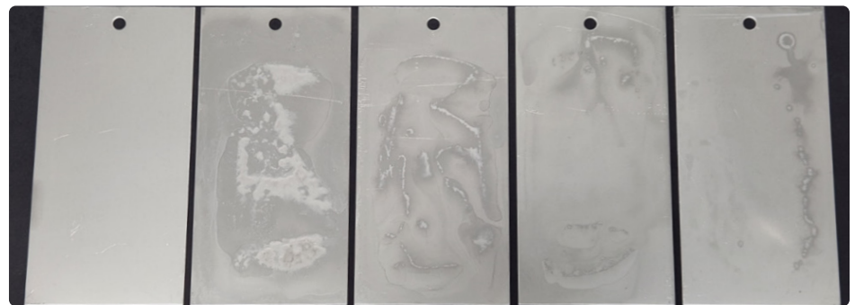
Détergent ProKlenz ALIGN