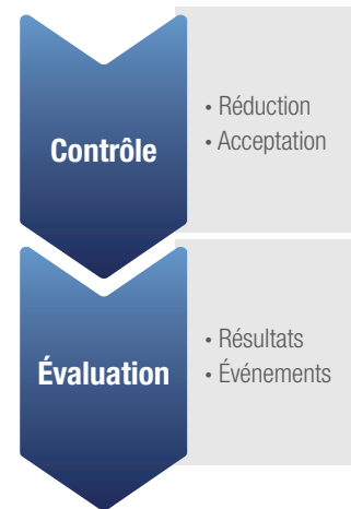
Figure 1. Éléments de contrôle et d’évaluation de la conservation de l’acier inoxydable.