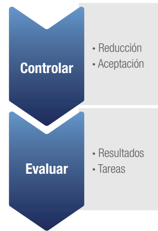
Figura 1. Elementos del control y evaluación de la conservación del acero inoxidable.

Este documento técnico analiza las mejores prácticas para establecer y evaluar un proceso de preservación del acero inoxidable y mitigación del rouge en la fabricación de productos farmacéuticos.